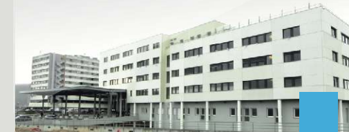
L'hôpital Jean Minjot, situé au cœur du Pôle santé