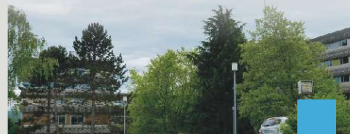
L'institut de formation de professions de santé (IFPS) aux Tilleroyes

Centre hospitalier régional et universitaire 2 place Saint-Jacques - 25030 Besançon Cedex Tél. 03 81 66 81 66