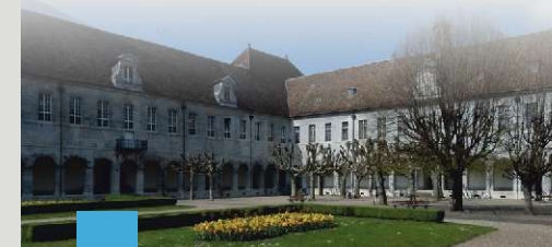
L'hôpital Saint-Jacques, situé au centre-ville