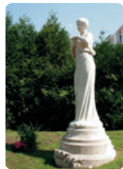
Statue de la Bonté