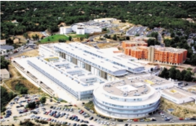
Groupe Hospitalo-Universitaire Carêmeau