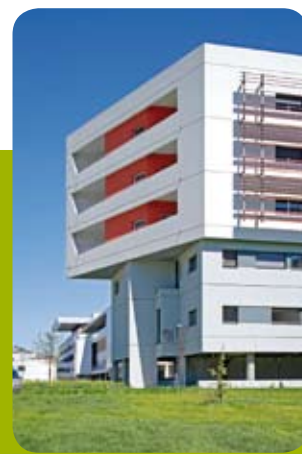
© BBG Architectes associés - photos © Serge Demailly