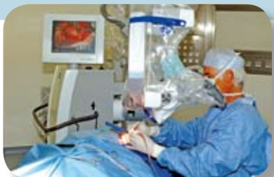
MCO* : Médecine, Chirurgie et Obstétrique